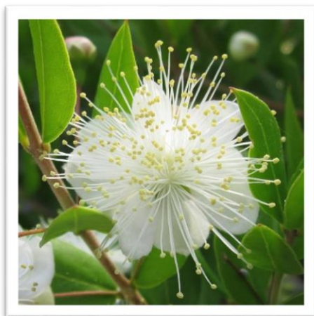
Fleur de myrte

Esther est une jeune femme juive, de la tribu de Benjamin et de la famille de Saül. Elle a vécu au 5 ème siècle avant Jésus-Christ, loin du pays de ses ancêtres. Son nom juif était Hadassah (Myrte), le prénom Esther est son équivalent chez les Mèdes. La fleur de myrte ressemble à une étoile, ce qui explique qu'Esther signifie aussi étoile (Astara en grec).